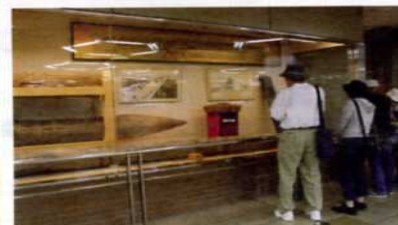
合併当時の二代目萬代橋の橋脚