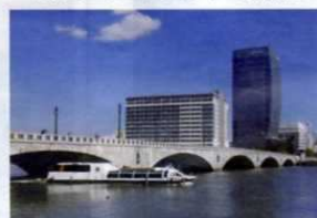
水上バスでの「船上まち歩き」