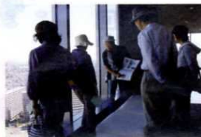
展望室でのまち歩き解説