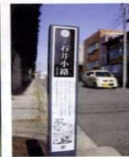
小路や神社が点在する沼垂地区