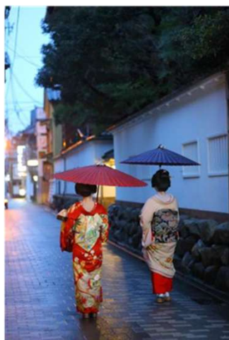
古町花街(鍋茶屋通り)