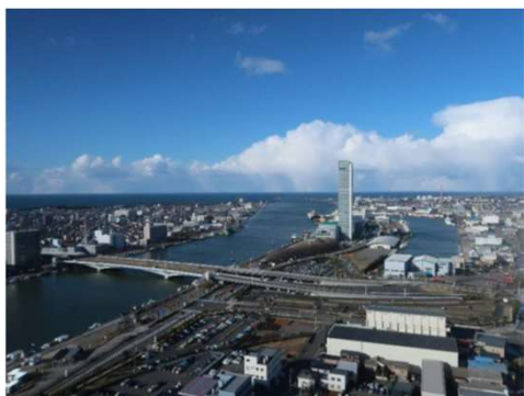
メディアシップ展望室