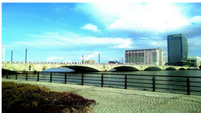
新潟市のシンボル信濃川と萬代橋