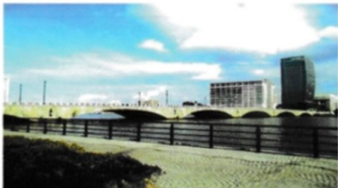
新潟市のシンボル信濃川と萬代橋