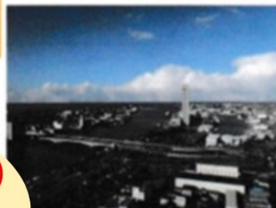
メディアシップ展望室

【注】期間限定で、予約不要のまち歩きを実施する予定です。 詳しくは当会のホームページでご確認ください。