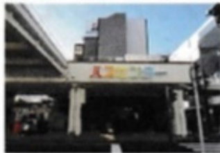
万代シティバスセンター