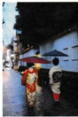
古町花街(鍋茶屋通り)